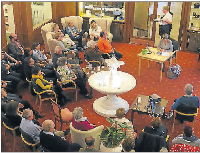
Die Veranstaltung im Badehof war gut besucht.