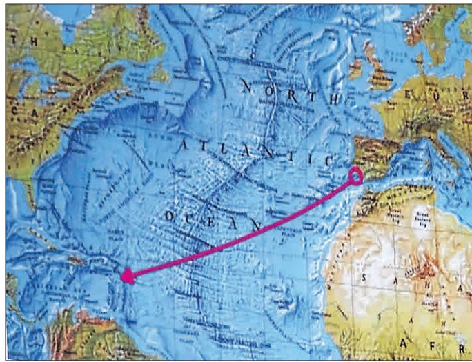
Die Reiseroute von Europa aus über den Atlantik.